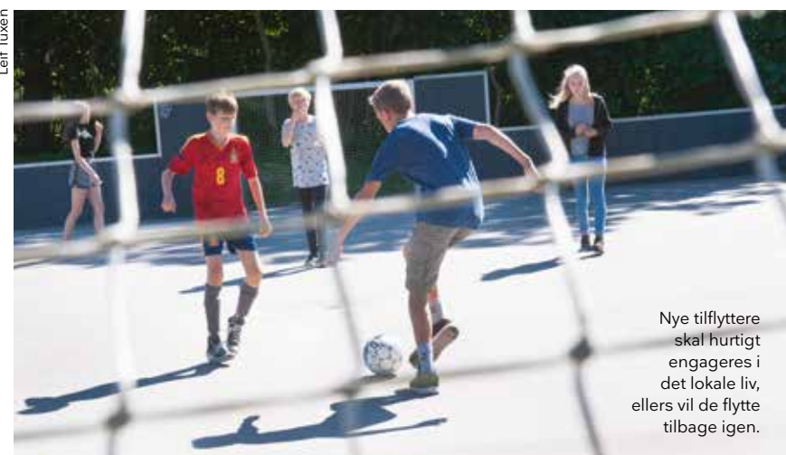
Nye tilflyttere skal hurtigt engageres i det lokale liv, ellers vil de flytte tilbage igen.