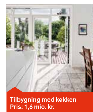
Tilbygning med køkken Pris: 1,6 mio. kr.