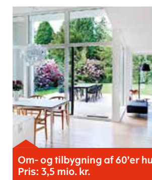
Om- og tilbygning af 60'er hus Pris: 3,5 mio. kr.